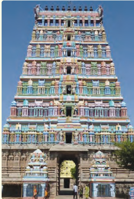
పిలిచేవారు. దీనికి సంబంధించిన శాసనాలు, రాతప్రతులు ఉన్నాయి.

ఈ ఆలయాన్ని శివపురం, దక్షిణ కైలాసం, చతుర్వేది మంగళం, ఇలాందికైపల్లి, బ్రహ్మపురం, వ్యాఘ్రపురం, మంగళపురి, ఆది చిదంబరం వంటి అనేక పేర్లతో