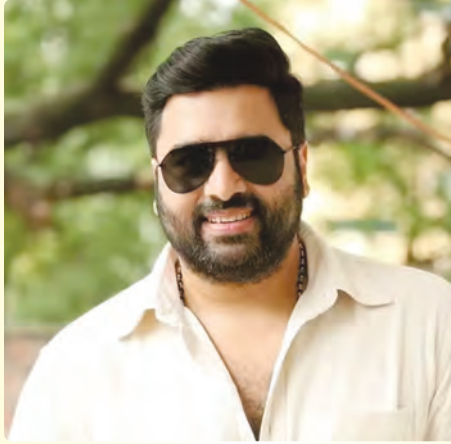
పాత్రలో చాలా వేరియేషన్స్ ఉంటాయని తెలుస్తోంది. అలాగే, ఈ

మె గాస్టార్ చిరంజీవి- బాబీ కొల్లి కాంచినేషన్ లో ఓ సినిమా రాబోతుంది. చిరంజీవి కెరీర్ లో 158వ చిత్రంగా తెరకెక్కుతున్న ఈ సినిమా పై ఓ క్రేజీ ఆప్ డేట్ వినిపిస్తోంది. ఈ సినిమా సినిమా కైమాక్స్ లో ఓ అతిథి పాత్ర ఉందని.. ఆ పాత్రలో మరో హీరో కనిపించబోతున్నాడనీ.. ఆ హీరో నారా రోహిత్ అని టాక్ నడుస్తోంది. ఇక ఈ సినిమా సెకండ్ హాఫ్ లో వచ్చే ప్లాష్ బ్యాక్ కోసం మెగా స్టార్ సరికొత్త లుక్ లో కనిపించబోతున్నాడు. పైగా ఈ సినిమాలో చిరు